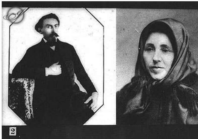
Gárdonyi Géza szülei

„Mennyi minden hever emlékezetemben – jegyzi naplójába -, csak végig kell gondolnom a gyermekkoromat. Megtalálom a múltban a jövőmet. Megtalálom azokban a csekély emlékjegyekben a karakterem első szárait, az indulataim első fellobbanásait, a megfigyelésekre való hajlandóságomat, a számok világa iránt való közömbösségemet, a természeti szépségek iránt való fogékonyságomat, érzelmi érzékenységemet, hibáimat és erényeim, s itt-ott már az azonosító képességemet, mely nélkül író nem lehettem volna.”